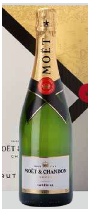
MOËT & CHANDON Brut Imperial REF. Q-102 - CAJA 6 BOT.