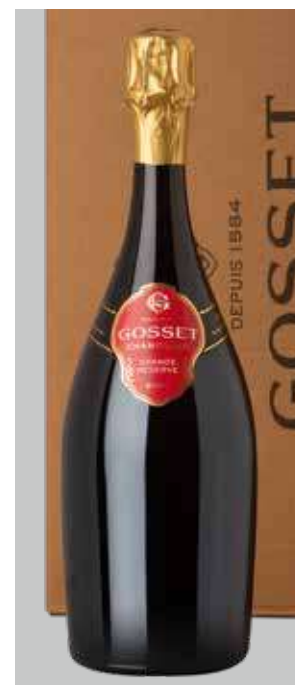
GOSSET Grande Reserve REF. Q-107 - CAJA 6 BOT.