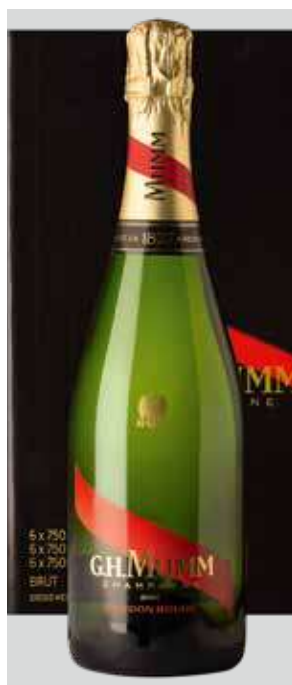
MUMM CORDON ROUGE Brut REF. Q-105 - CAJA 6 BOT.