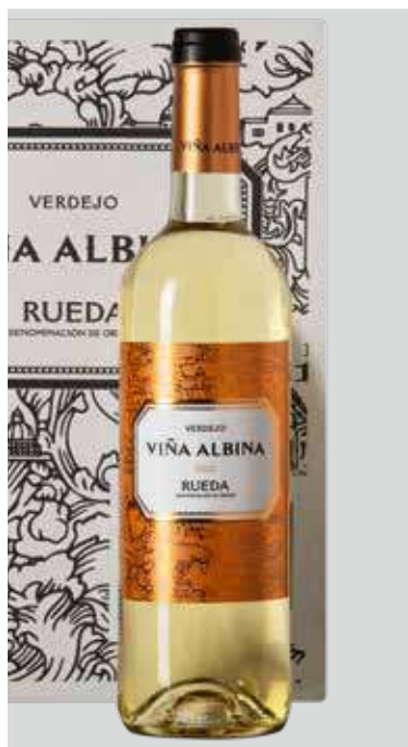
VIÑA ALBINA Blanco Verdejo BODEGAS RIOJANAS D.O. RUEDA REF. V-46 - CAJA 6 BOT.