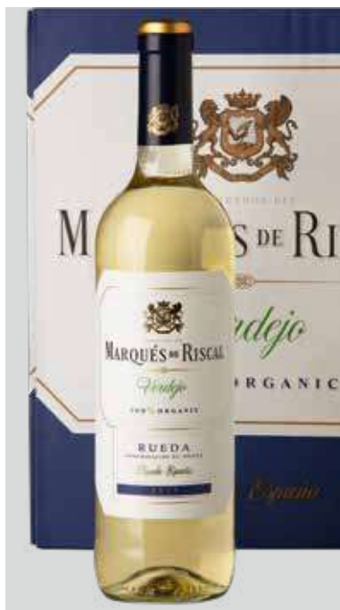
MARQUÉS DE RISCAL Blanco Verdejo BODEGA HEREDEROS MARQUÉS DE RISCAL D.O. RUEDA REF. V-26 - CAJA 6 BOT.