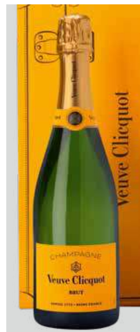
VEUVE CLIQUOT Yellow Label REF. Q-101 - CAJA 6 BOT.