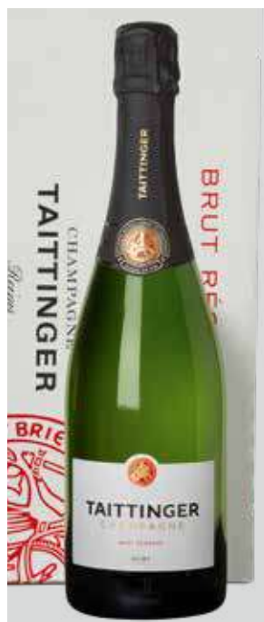
TAITTINGER Brut Reserve REF. Q-106 - CAJA 6 BOT.