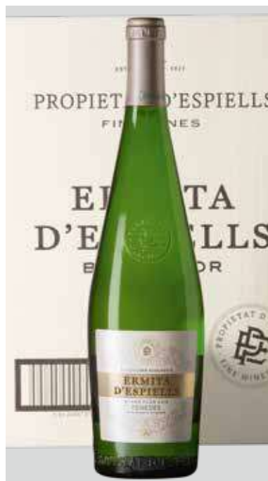
JUVÉ & CAMPS Ermita d'Espiells BODEGAS JUVÉ CAMPS D.O. PENEDES REF. V-31 - CAJA 6 BOT.