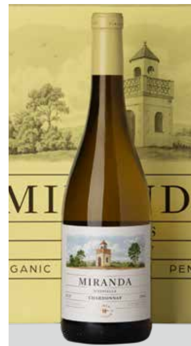
JUVÉ & CAMPS Miranda d'Espiells BODEGAS JUVÉ CAMPS D.O. PENEDES REF. V-34 - CAJA 6 BOT.