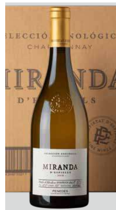
JUVÉ & CAMPS Miranda d'Espiells BODEGAS JUVÉ CAMPS D.O. PENEDES REF. V-34 - CAJA 6 BOT.